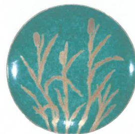
二代徳田八十吉 豊秋飾皿