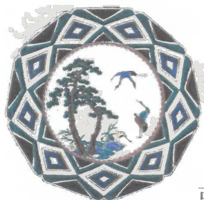
初代徳田八十吉 古九谷欽慕松鶴図九角皿