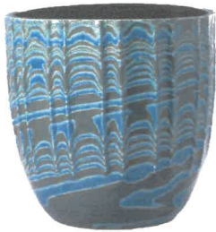
三代徳田八十吉 深厚耀彩線文壺