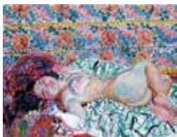
宮本三郎《更紗の前》1968年