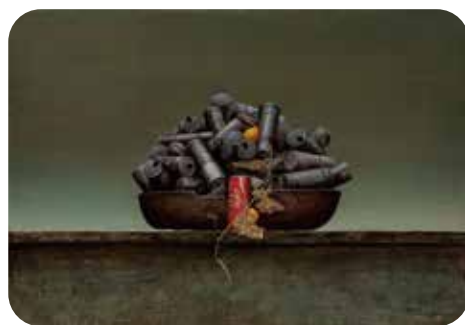
上段・五十嵐陽子《さて、その役は?》油彩、2005年/下段・(左) 生地太久《作品'86-3 空》油彩、1986年 (中央) 吉田富士夫《催眠術'77》油彩、1977年/ (右) 清水鍊徳《驟雨(荒船山)》油彩、1986年頃