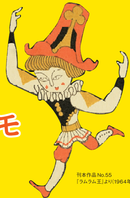
刊本作品 No.55 「ラムラム王」より(1964年)