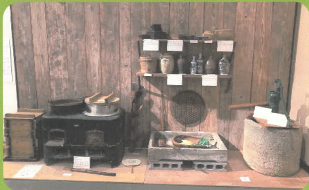
昭和 20 年代の台所

とうきかくてん 当企画展は、SDGs の「7 エネルギー をみんなにそしてクリーンに」という もくひょう おお 目標と大きくかかわる、でんき ちやくもく 電気に着目し ています。