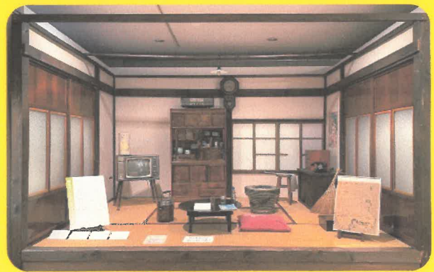
昭和 40 年代の茶の間